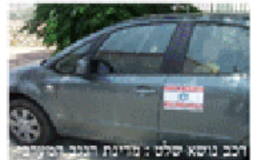
רכב נושא שלט: מדינת הנגב המערבית

מרבית הציבור בישראל חש כי ה"ירגיעה" היא זמנית ושבירית. מסקר "ידיעות אחרונות" ומינה צמח/דחף אשר פורסם ביום ו' 20/06/08, עולה כי 79% אינם